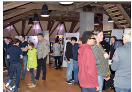
Grossandrang von wissbegierigen Oberstufenschülern an der Berufsshow im Dachstock des Kreuz in Herzogenbuchsee.